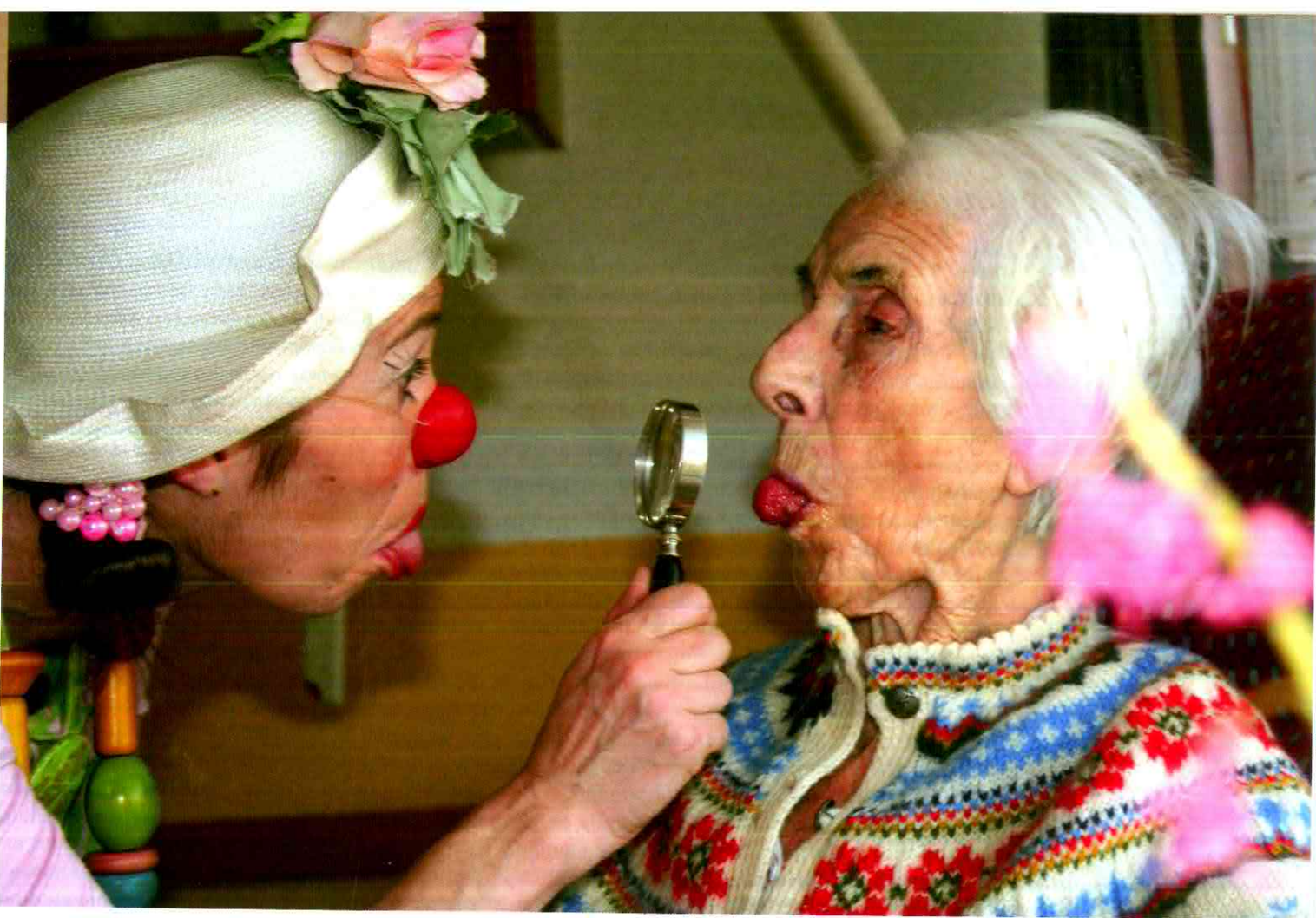
Voller Leichtigkeit und doch hochkonzentriert ist der Umgang der Clownin mit den demenzerkrankten Menschen.

lage fürs Clownsspiel und die Kopplung auf der emotionalen Ebene bildet eine sehr starke Basis im Versuch, individuelle Bedürfnisse zu erfüllen.