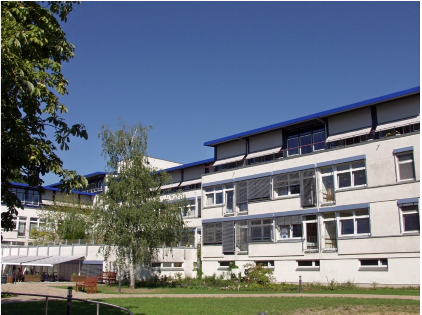
Abbildung: Strukturierter Qualitätsbericht gemäß §137 Abs.3 Satz 1 Nr.4 SGB V für das Berichtsjahr 2010

Vitanas Krankenhaus für Geriatrie im Märkischen Viertel Berlin